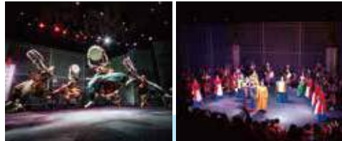
▲ The Queen's Banquet