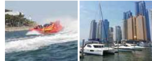
▲ The Bay 101 Yacht Club