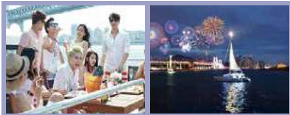
▲ Samjoo Diamond Bay

예약문의 : 051)726-8855 (문의 시간 : 오전 9시 ~ 오후 6시) 홈페이지 : www.blue-marine.co.kr 주소 : 부산광역시 해운대구 동백로 52