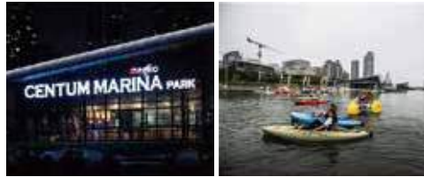
▲ Centum Marina Park