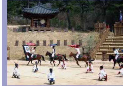
▲ 천마총 (CHEONMACHONG TOMB)