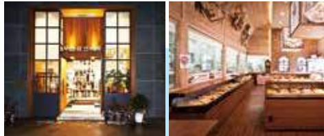
▲ Samjinfood Co.Ltd