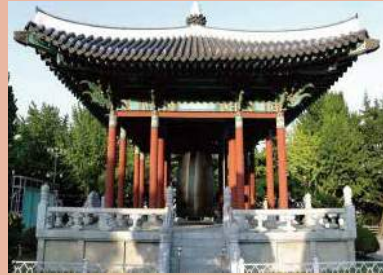
▲ 용두산공원 (YONGDUSAN PARK)