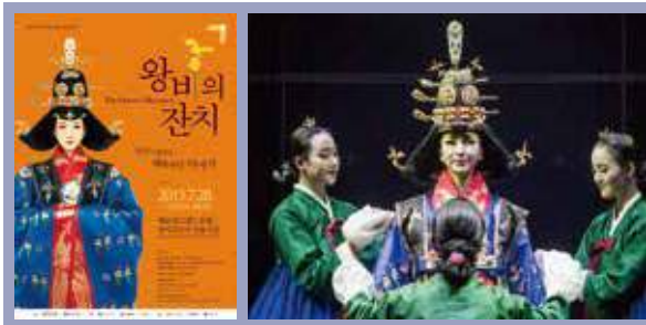
▲ 왕비의 잔치