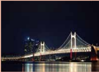
▲ 부산의 야경 (NIGHT VIEW OF BUSAN)