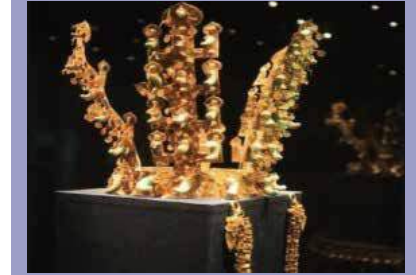
▲ 국립경주박물관 (GYEONGJU NATIONAL MUSEUM)