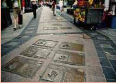
▲ BIFF 광장 (BIFF SQUARE)