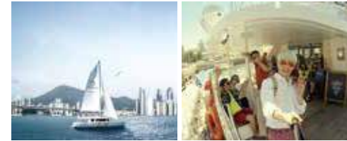
▲ Samjoo Diamond Bay