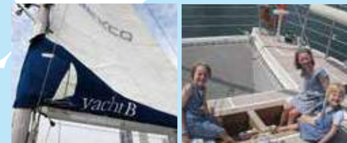
▲ Yacht B