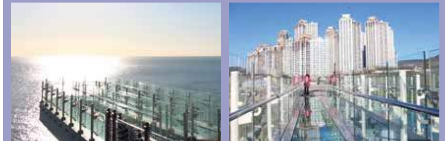
▲ 스카이워크 (SKYWALK)