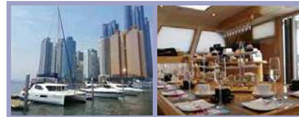
▲ The Bay 101 Yacht ▲ Yacht B

Tel. +82-51-726-8855 (Office Hour : 9:00am - 6:00pm) Website : www.blue-marine.co.kr Address : 52, Dongbaek-ro, Haeundae-gu, Busan, Korea